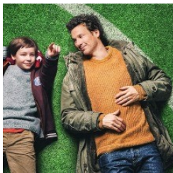
Text & Fotos: Bettina Walter

Wir laden herzlich zum jährlichen Kinoabend ins Marktschorgaster Gemeindehaus ein. Wir schauen am Freitag, den 7.11. gemeinsam den Film „Die Wochenendrebellen“ (FSK 6). Der Film handelt von einem Vater, der mit seinem autistischen Sohn als Groundhopper verschiedene Stadien der deutschen Bundesliga besuchen. Ein Film nicht nur für Fußballfans! Es gibt wieder Getränke, Eiskonfekt und Popcorn. Alles auf Spendenbasis. Wir freuen uns auf euch und starten um 19:30 Uhr. Einlass ist ab 19:00 Uhr .