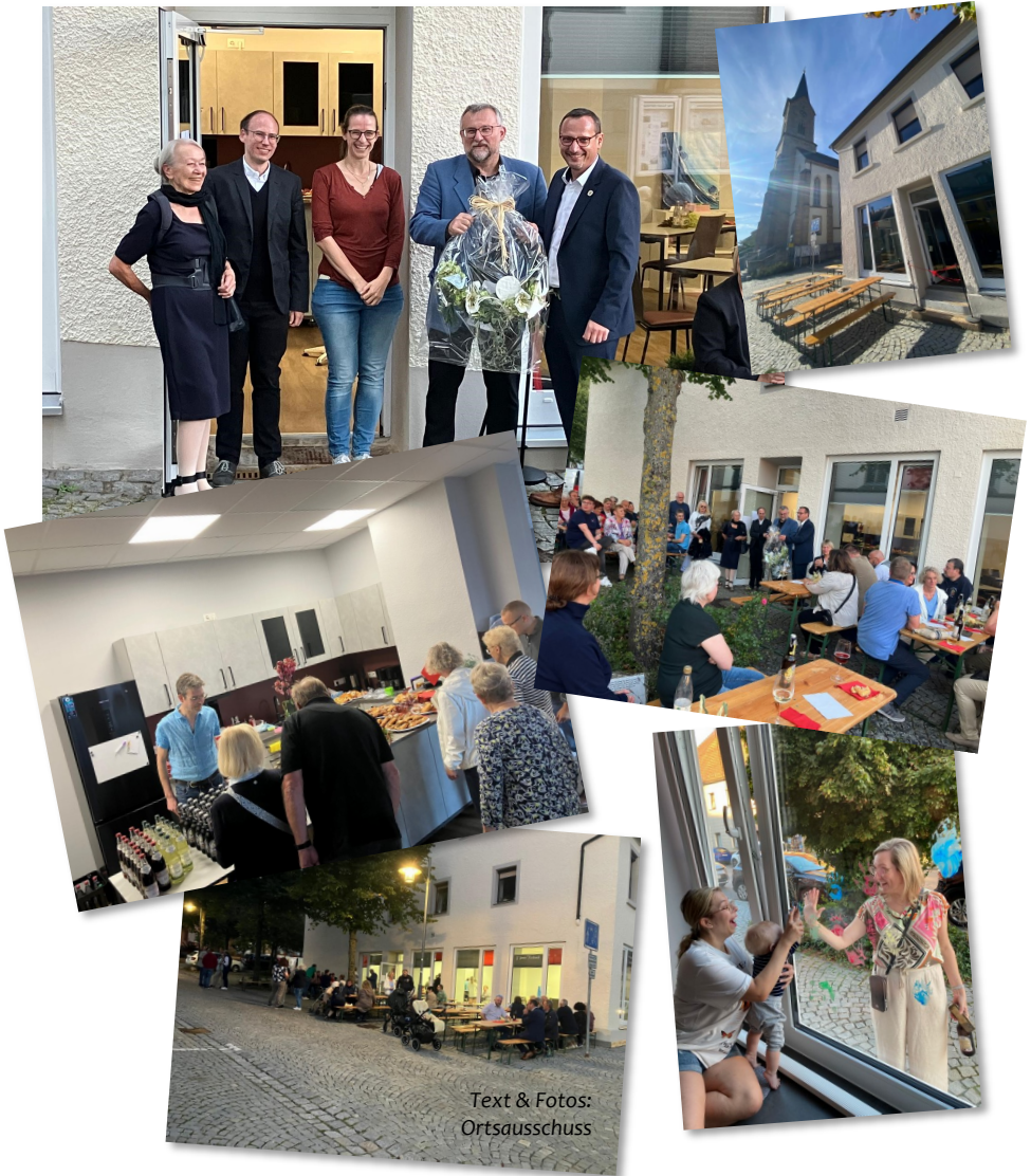
Text & Fotos: Ortsausschuss

Bei bestem Wetter, leckeren Snacks und noch besserer Gesellschaft feierten wir Ende September endlich die offizielle Einweihung des G'freiser Kirchenecks. Was für ein schöner Abend - ein herzliches Dankeschön an all die helfenden Hände des Ortsausschusses Gefrees und des Kirchenvorstandes. Neugierig geworden? Kommen Sie einfach mal vorbei - z.B. am 09.11. zum „Essen fassen“ (S.17)!